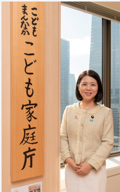
こども家庭庁にて