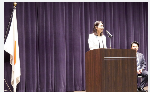
内閣府の職員の皆さまとの就任挨拶式