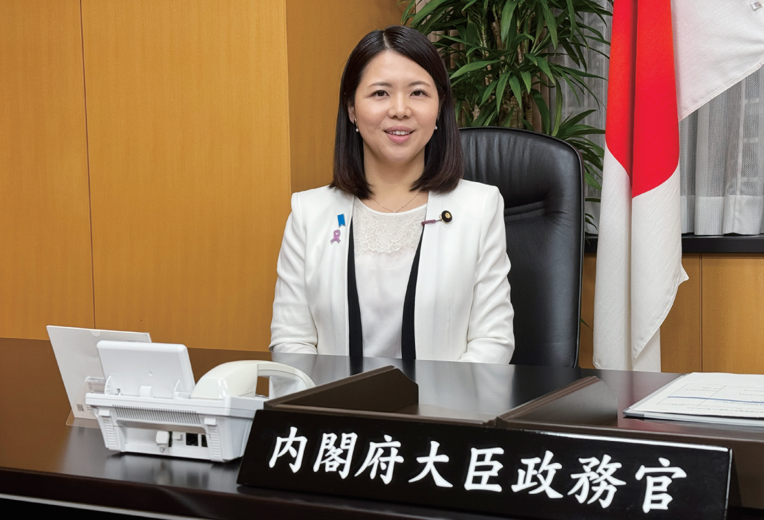
内閣府大臣政務官室にて