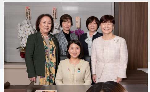
こども家庭庁大臣政務官室にて