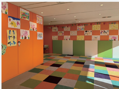
こどもまんなか広場（こども家庭庁）