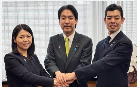
城内実大臣 三原じゅん子大臣 辻清人副大臣